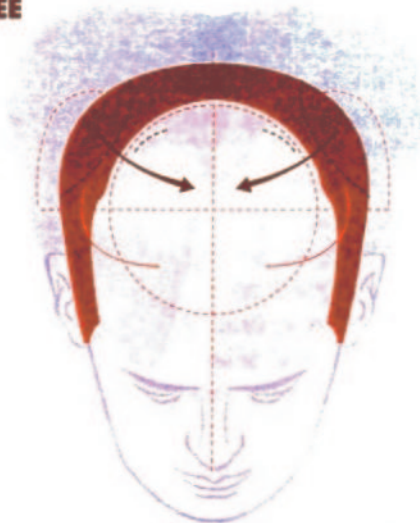
Implantation des ballonnets et gonflage